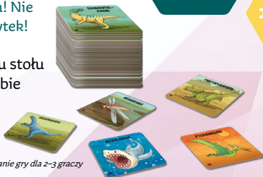
Przygotowanie gry dla 2-3 graczy

Uwaga! Każdy gracz bierze tylko jedną płytkę – nie może wziąć kilku płytek ani nie może zrezygnować z dobierania.